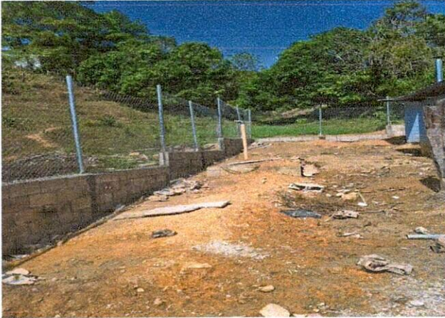
Foto 1: Sustitución de portón y pavimentación de la entrada con graderío