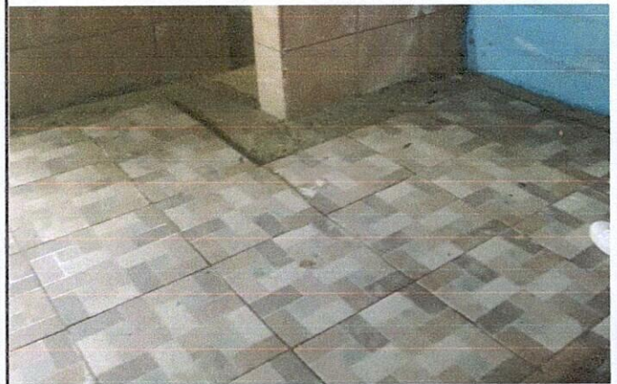
Foto 4: Instalación de piso cerámico en el corredor del establecimiento

Observación: Si es necesario se pueden agregar hojas adicionales y actualizar el número de hojas.