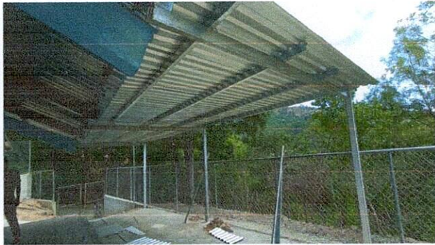
Foto 3: Estructura de costaneras techado lámina y sus canales e instalación de energía y luminación